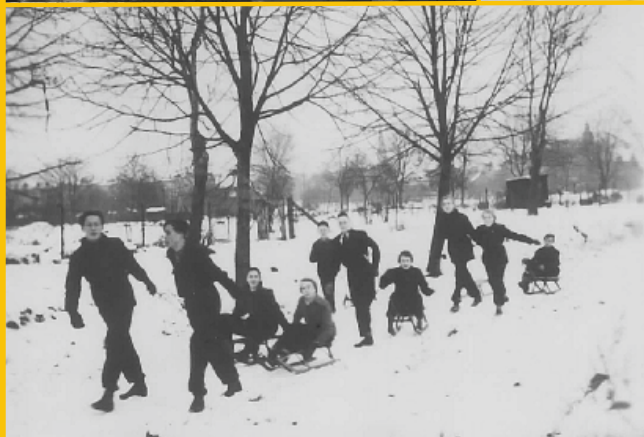
Rodel- vergnügen Richtung Schwarzer Berg