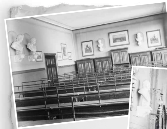
Zeichensaal und Aula Fotos aus dem Jahr 1896 von Herbert Hausmann

© Gustav-Adolf Biewald / Hilmar Gudziol, gekürzt Ch. Apfel