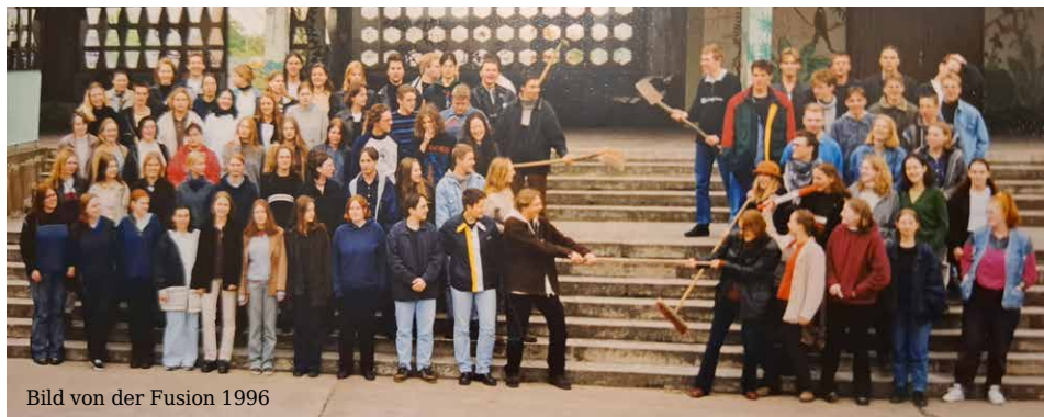
Bild von der Fusion 1996

Als erster Abschlussjahrgang nach der Fusion des Jahn- und des Schweitzer-Gymnasiums verbindet uns bis heute eine besondere Zeit. Die Freude über das Wiedersehen war groß - und natürlich stand am Ende des Abends schon die Idee im Raum, sich spätestens zum 30-jährigen Jubiläum wiederzutreffen.