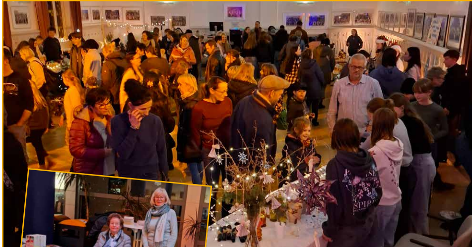
Die Vereinigung der Ehemaligen war mit einem Bücherstand dabei.