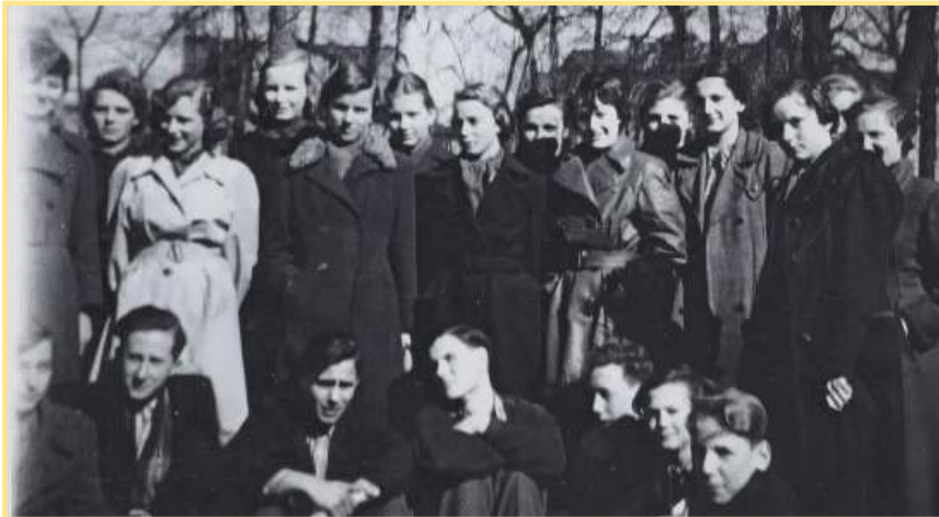
Klasse 10a im März 1953