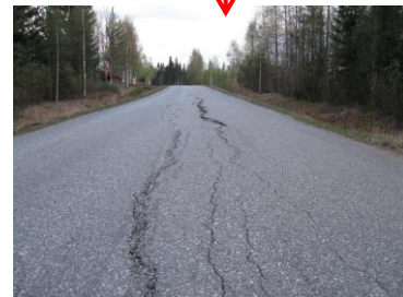
Asphalt zum Straßenbau