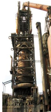
Hochöfen in der Eisen- und Stahlindustrie