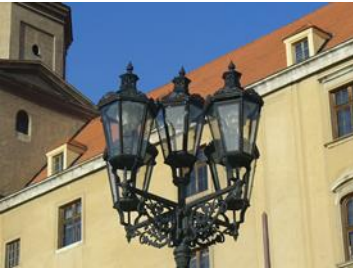
alte Straßenlaterne (gasbetrieben)