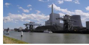
Erzeugung von Elektroenergie